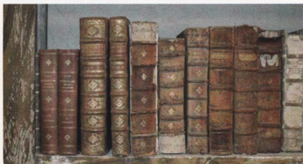
Les ouvrages conservés dans la Grande Bibliothèque remontent à la fondation du Séminaire.

Le Séminaire de Saint-Flour a été fondé par l'évêque Jacques de Montrouge en 1651. Entre 1752 et 1762, Mgr Paul de Ribeyre fait construire le Grand Séminaire, vaste bâtisse à la façade majestueuse, adossée au flanc sud de la cité médiévale de Saint-Flour. En 1840, Mgr de Marguerye fait bâtir une aile qui abritera la nouvelle « Grande Bibliothèque ». Les travaux furent réalisés selon les plans d'Arveuf, architecte à Paris.