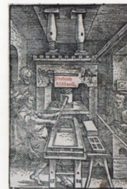
Marque de l'imprimeur Josse Bade, 1520

Aujourd'hui la Grande Bibliothèque ressemble un peu à certaines églises de campagne qui ne servent plus qu'une ou deux fois par an, se figent et se couvrent de poussière. Mais tout comme l'église de campagne, elle a besoin d'être protégée, car si elle sert peu, si le fonds n'est pas (encore) informatisé, elle ne réclame pas moins d'être entretenue et restaurée, car elle recèle de nombreux trésors.